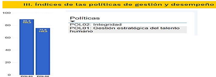
Gráfico 2. Resultado Índice de Gestión y Desempeño de la política de gestión estratégica de talento humano y la política de integridad